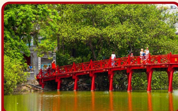
ชมสะพานแสงอาทิตย์ และ ทะเลสาบคินดาบ ทะเลสาบใจกลางเมืองฮานอย