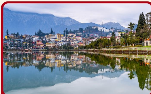
ทะเลสาบซาปา ทะเลสาบกลางเมืองซาปา