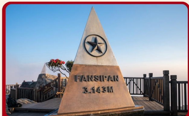
นั่งกระเช้าสู่ยอดเขาฟานซิปัน