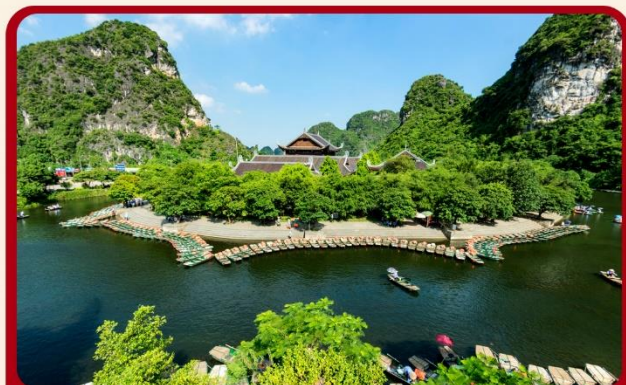
ล่องเรือจ้างอ่าง ชมวิถีกุ้ยหลินแห่งเวียดนาม